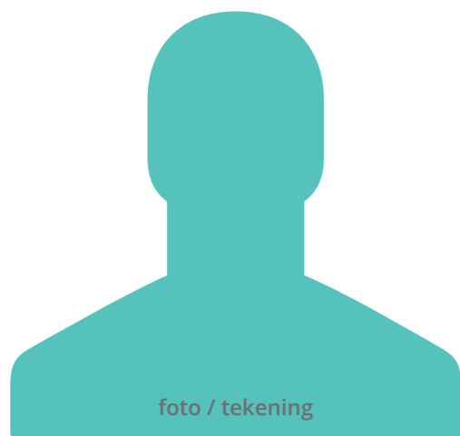
foto / tekening